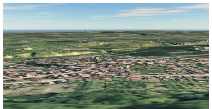
Ansicht vom Grafenberg