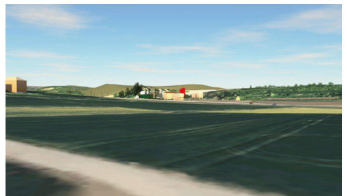
Ansicht von Ackerflächen und Gewerbegebiet Hagen (Westen)