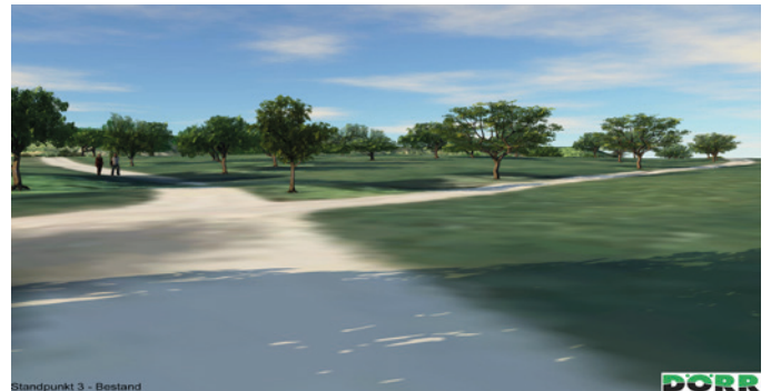
Ansicht von Ortsrandlage Altingen

Der Blick auf die Schwäbische Alb wird von den Wanderwegen am Schönbuchrand, unterhalb des Grafenberges, nicht beeinträchtigt.